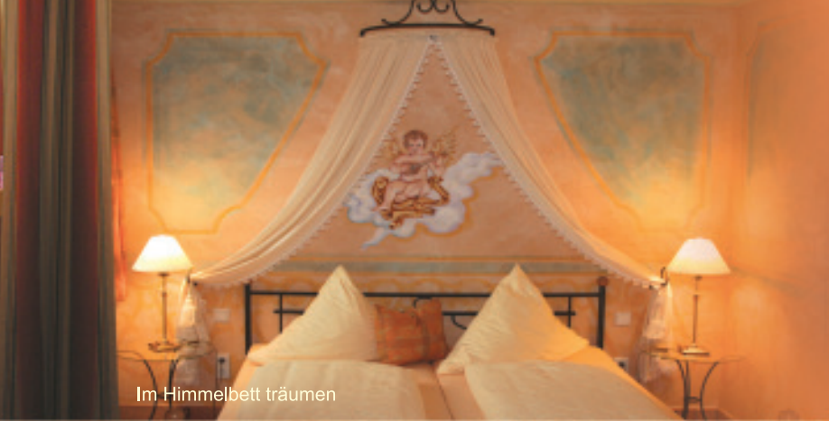
Im Himmelbett träumen