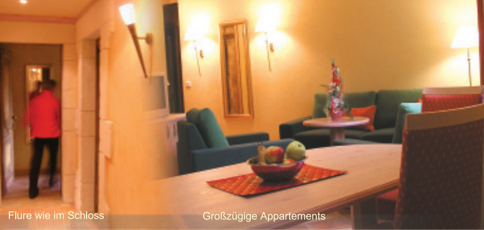
Flure wie im Schloss