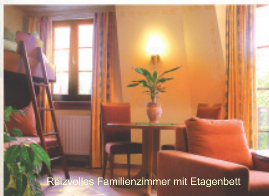
Reizvolles Familienzimmer mit Etagenbett